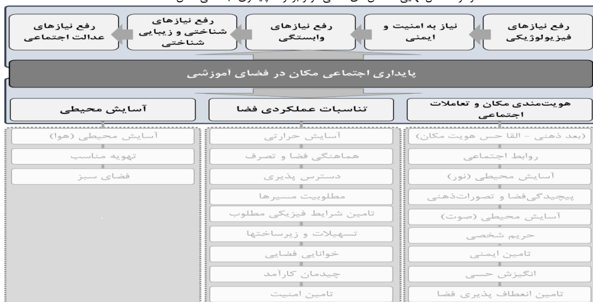
نمودار ۳: مدل نهایی شاخص‌های مکانی موثر بر ارتقا پایداری اجتماعی مکان.