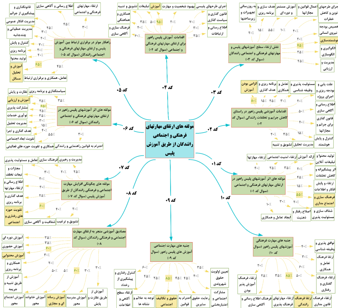
شکل ۲- مدل نهایی ابعاد مختلف الگوی ارتقای مهارت‌های فرهنگی و اجتماعی رانندگان با آموزش نیروهای پلیس.